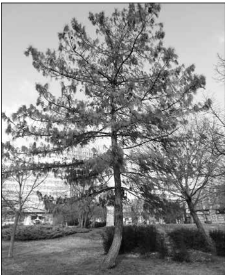
Himalájai selyemfenyő hosszú, csüngő tülevelekkel

Közép- és Dél-Európából származó, 20-30 méterre megnövő, fiatalon széles kúp alakú, később ernyő formájú, sötétszürke, barázdált kérgű fa. Tülevelei kettesével állnak, 8-16 cm hosszúak, sötétzöld színűek. Tobozát („nagy rózsatoboz”) koszorúkötészetben használják. Oszlopos növekedésű fajtái vannak. Napfényigényes, fagytüró, száraz helyeken is megél.