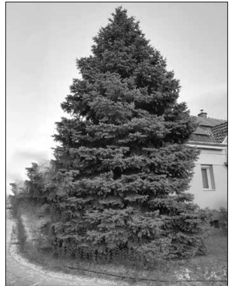
Kúpos koronájú szürke luc (ezüstfenyő)

Észak-Amerikából származik. 20-30 méter magas, kúpos koronájú fa, a