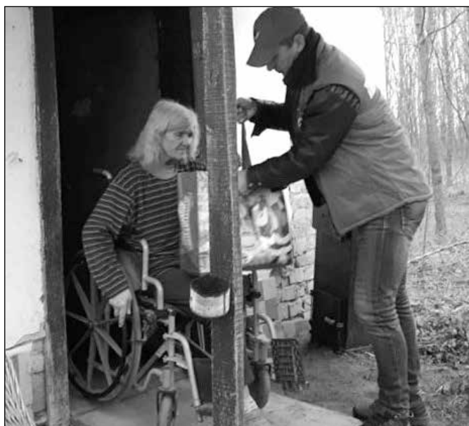
Helvécián ajándékcsomagokat vittek hához

Évek óta kapunk egy kecskeméti magánszemélytől karácsony előtt ajándékcsomagokat, amelyeket rászoruló egyedülállók, vagy kisgyermeket nevelő nagycsaládok részére juttattunk el tanyagondnok segítségével. Tavaly decemberben négy darab, tartós élelmiszert tartalmazó ajándékcsomagot, két darab, 5 év körüli kisfiú részére összeállított „cipősdobozt”, ágyneműt (paplan, párna) és több zsák használt, jó állapotú (tisztított) ruhát ajánlott fel.