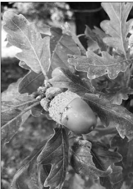
A kocsánytalan tölgy ülő makktermése