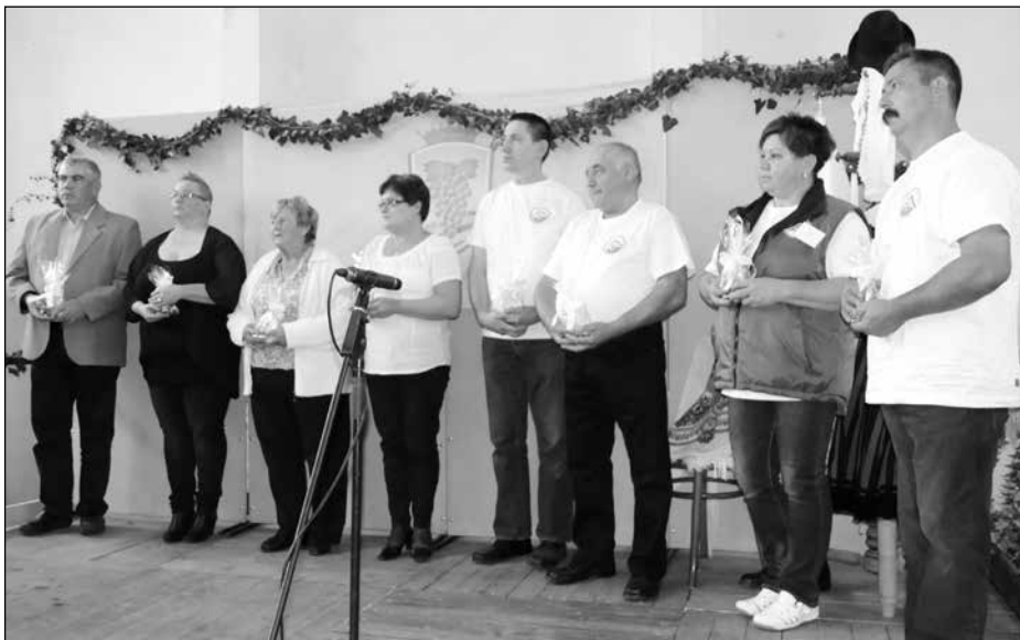
Egykori és jelenlegi falugondnokok

gyógyszernél – vallják a mórahalmi tanyagondnokok. A hétköznapi hősök időjárástól, útviszonyoktól függetlenül járják minden nap a tanyavilágot, napi 150 kilométert autózva, hogy mindenhova eljussanak, ahol várják őket.