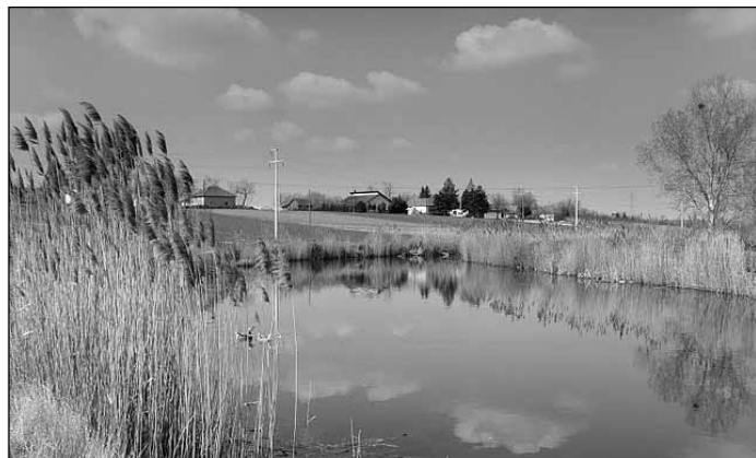
Körös part

Kispiac két magyarországi testvértelepüléssel büszkélkedhet, Nagymágocssal és Öttömössel.