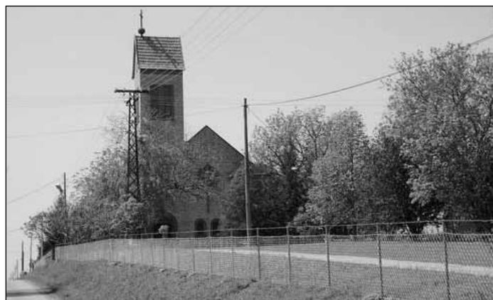
A Szent Péter és Pál apostolok templom

E térség a török előtt mint kun terület Csongrád, majd utána Bács-Bodrog megyéhez tartozott – tehát több mint ezer évig az egykori Magyarország szerves részét képezte. Közben a XVIII. század közepétől Felső-Pucs területén a Szalatornya (Sztara Torina) név jelenik meg. Valószínűleg az 1848/49-es magyar szabadságharc idején itt megfigyelőtorony állhatott. A II. világháborút követően az új államhatalom Felső-Pucs területét, annak betelepült részét Nosza névre keresztelte. Alsó-