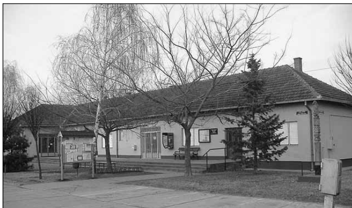
A közösségi ház

Ma a lakosság zöme állattenyésztéssel, gyümölcs- és kerti vetemények termesztésével foglalkozik. A Kispiac környéki földeken leginkább iparnövényeket, gabonaféléket és kultúrnövényeket termesztenek, de nagy hagyománnyal rendelkezik a